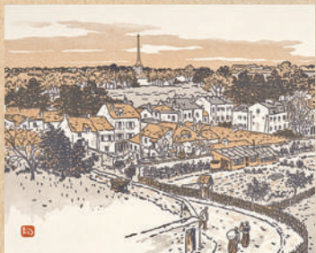
③(バムードン駅より)