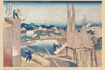
⑦(本所立川) ⑧～⑩葛飾北斎「富嶽三十六景」より 光ミュージアム蔵

江戸後期に活躍した浮世絵師、葛飾北斎(1760-1849)は、天保年間に描いた『富嶽三十六景』により、浮世絵の風景画というジャンルを確立させました。平面的でありながら、大胆で洗練された構図と鮮やかな色彩は、ゴッホをはじめモネやドガなど印象派を中心とした多くの画家たちに影響を与え、ヨーロッパの美術界にジャポニスム(日本趣味)と呼ばれる一大ブームを巻き起こしました。