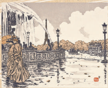
②(コンコルド広場より)